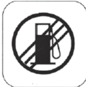
Ende der Tankzone