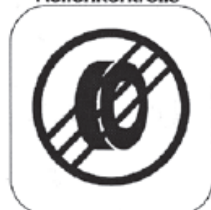
Ende der Reifenmarkierung / Reifenkontrolle