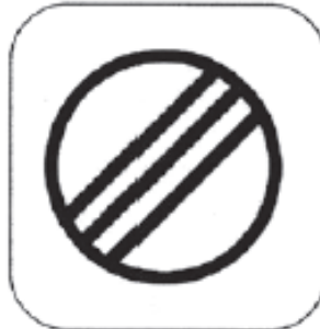
Ende der Kontrollzone