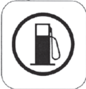
Anfang der Tankzone

Farbe Anfang der Kontrollzone: GELB Farbe Kontrollposten: RÖT