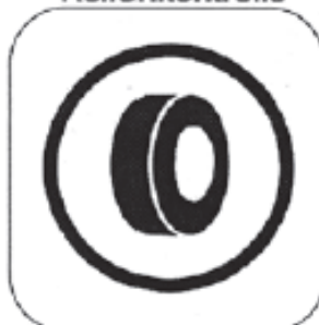
Anfang der Reifenmarkierung / Reifenkontrolle

Farbe Hinweis auf Posten: GELB Farbe Kontrollposten: BLAU