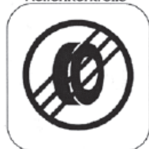
Ende der Reifenmarkierung / Reifenkontrolle